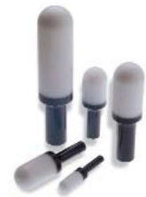
Silencieux à racc. instantané ou avec embout de raccordement

Protègent les appareils contre l'introduction de poussière